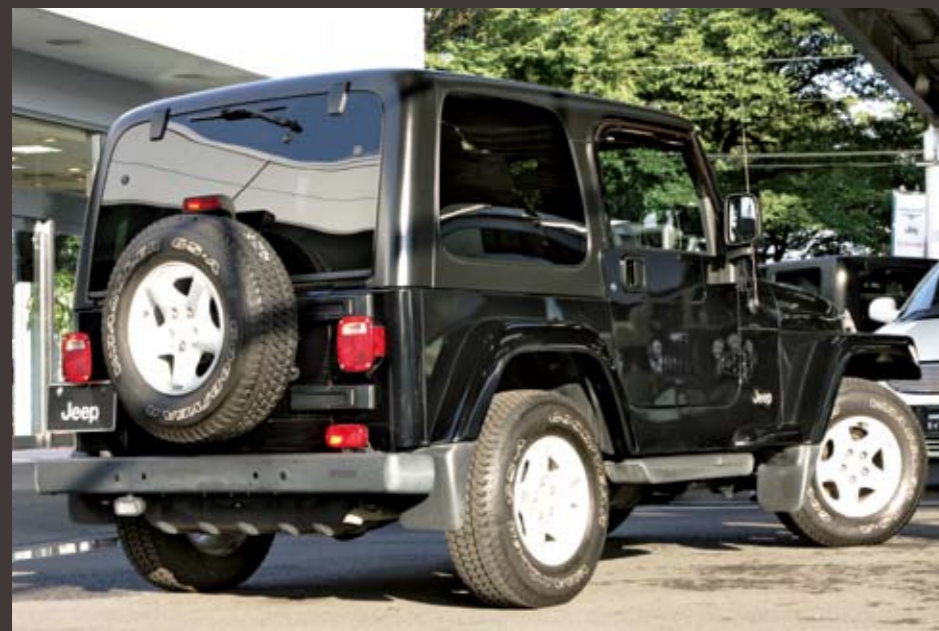
ジープの認定中古車は新車登録から7年未満の車両が対象なので、ラングラーTJなら'04年以降のモデルとなる。サンプルカーは'05年式のラングラーTJサハラ。1.6万kmの低走行極上車で、プライスタグは198万円。