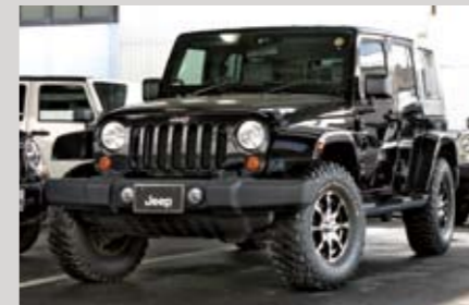
今後認定中古車が増えそうなラングラーJKは、'07モデルのアンリミで368万円。走行距離は2.7万km。