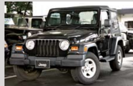
'05年のスポーツ。3.9万kmの走行距離のうち、オフロードは未走行の下取り入庫車で、158万円。