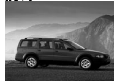
■XC70認定中古車相場の目安 (単位=万円)