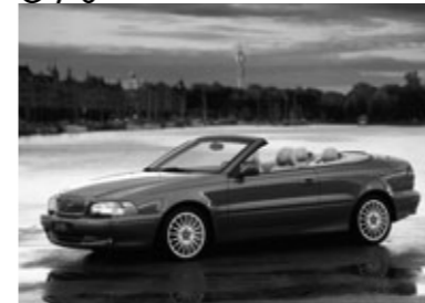
■C70認定中古車相場の目安 (単位=万円)