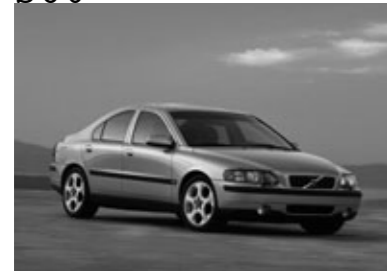
■S60認定中古車相場の目安 (単位=万円)