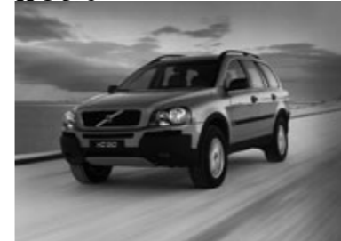
■XC90認定中古車相場の目安 (単位=万円)