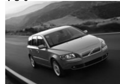
■V50認定中古車相場の目安 (単位=万円)