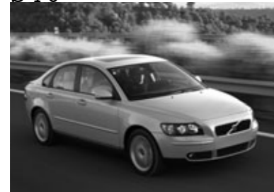
■V40認定中古車相場の目安 (単位=万円)