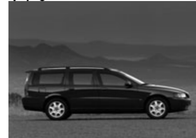
■V70認定中古車相場の目安 (単位=万円)