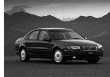
■S80認定中古車相場の目安 (単位=万円)